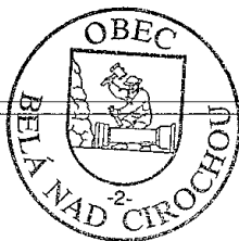
Ján Vajda starosta obce

rozpočtové opatrenie č. 2012/1 zo dňa 15.05.2012.